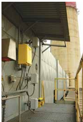
Widok istniejącej instalacji w kanale spalinowym

Sondy przepływomierzy termicznych MT91 zostały zabudowane za pomocą króćców montażowych z przyłączem kołnierzym. Obudowa sond skonstruowana na potrzeby projektu wykonana została z włókna szklanego. Zastosowanie włókna skutecznie zmniejsza bowiem podatność sond na korozję, która w niewielkiej odległości od kominu stanowi poważne zagrożenie dla metalowych skrzynek. W dogodnym dla pracowników miejscu, zainstalowana została rozłączna elektronika zbierająca sygnały z poszczególnych czujników (obsługa ułatwiona została dzięki dużemu wyświetlaczowi LCD). Układ został skonfigurowany tak, że wyjście analogowe 4-20 mA przesyła informację na temat wielkości przepływu do systemu nadrzędnego, a wyjścia przekaźnikowe informują obsługę o ewentualnej awarii któregośkolwiek z czujników.