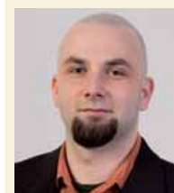
Autor artykułu: Wojciech Misz

Zakończona sukcesem inwestycja daje nam powody do dumy, a Klientowi możliwość sprawnego procesu monitorowania emisji spalin. Wkrótce powinniśmy rozpocząć realizację kolejnych układów tego typu, zwiększając tym samym potencjał polskich emitentów CO 2 na rynku uprawnień do emisji spalin.