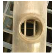
Czujnik pomiarowy po 6 miesięcznej, ciągłej pracy w kanale spalin

Dodatkowym, ważnym atutem termików jest konstrukcja sond, która zapewnia proces samoczyszczenia, co zapobiega oblepieniu czujników pomiarowych, nawet przy bardzo zapyłonym medium. Całkowicie zwilżane powierzchnie są skonstruowane ze stali nierdzewnej 316 lub Hastelloy C-276 (opcja w przypadku zwiększonej zawartości SO 2 w spalinach).